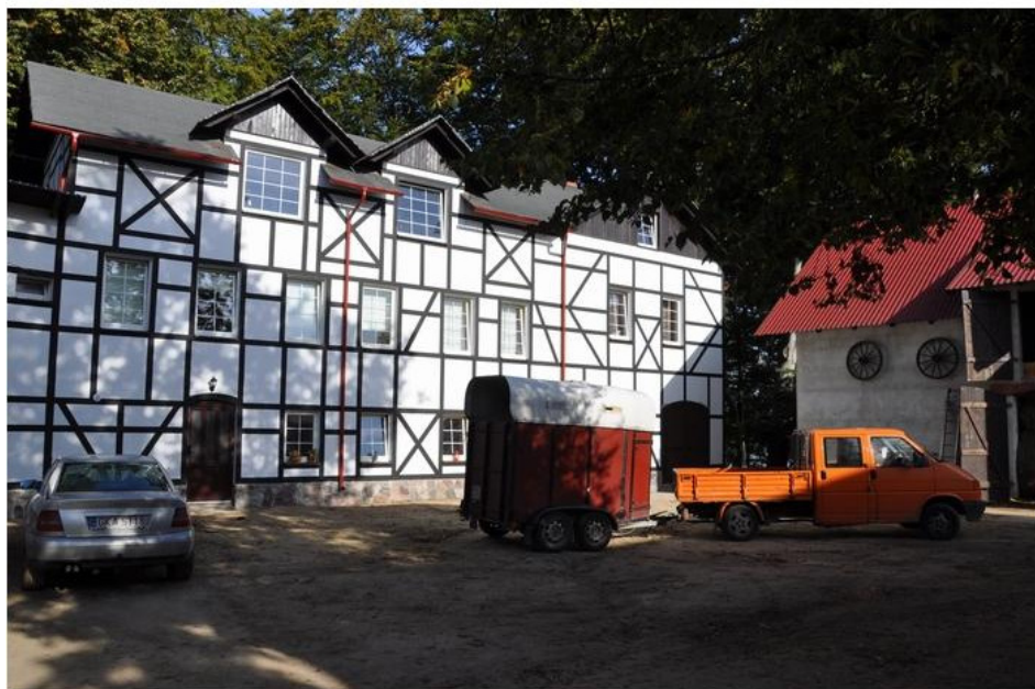
„Kolano” – stadnina-gospodarstwo agroturystyczne Wieżyca-Kolano 74 83-315 Szymbark