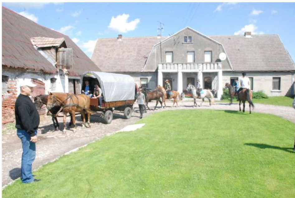
Gospodarstwo agroturystyczne „U Furmana pod Lasem”