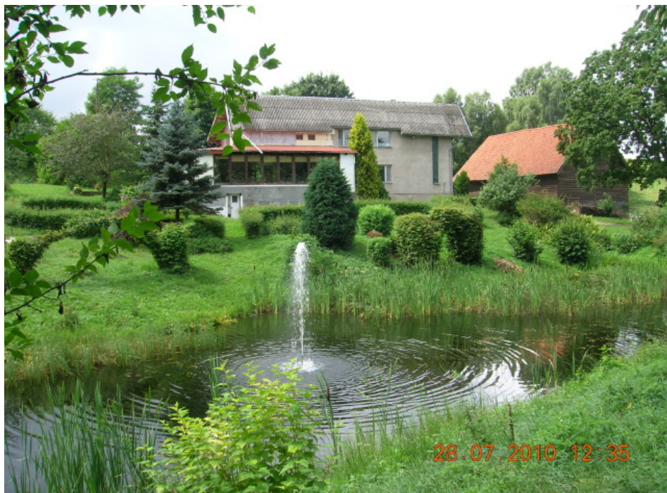
Gospodarstwo agroturystyczne „Platte” Gierzwałd 45 14-107 Gierzwałd