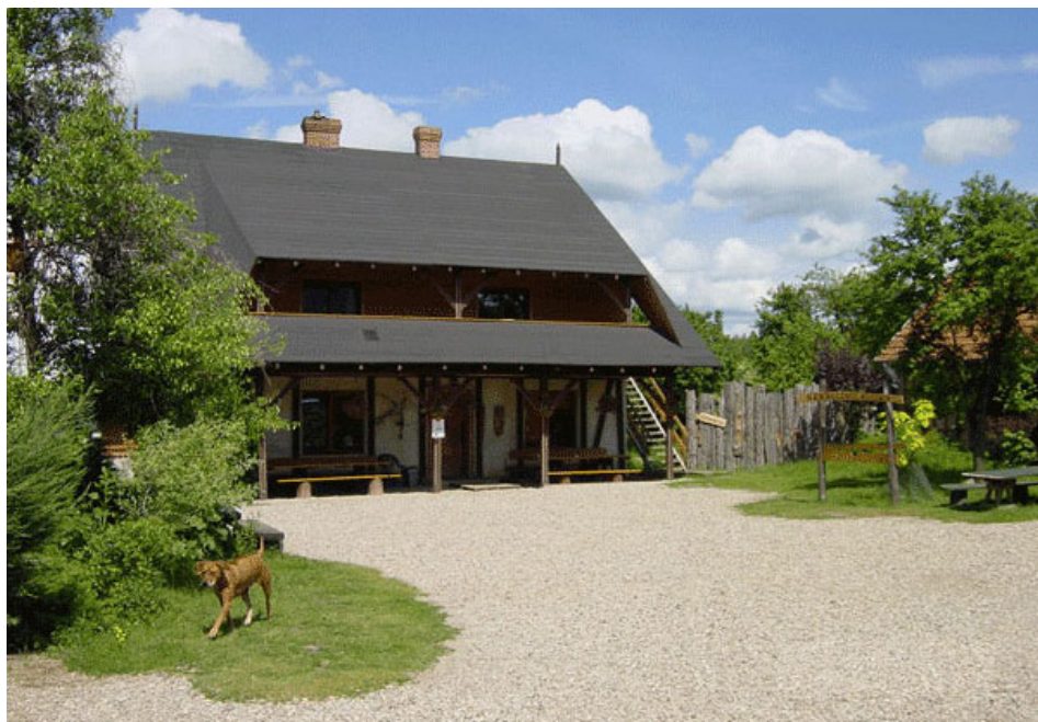
Gospodarstwo agroturystyczno-ekologiczne „Stajnia Leżno” Małe Leżno 44 87-313 Brzozie

Województwo kujawsko-pomorskie jest położone w północnej części Polski, między Pojezierzem Pomorskim i Mazurskim. Od czasu reformy administracyjnej państwa w 1999 roku obejmuje ono 3 byłe województwa tj. bydgoskie, toruńskie i włocławskie. Wielkim atutem województwa kujawsko-pomorskiego jest dobry stan środowiska naturalnego i występowanie obszarów czystych ekologicznie, jest tu m.in. Nadwiślański Park Krajobrazowy, Pojezierze Brodnickie oraz Chełmiński Park Krajobrazowy.