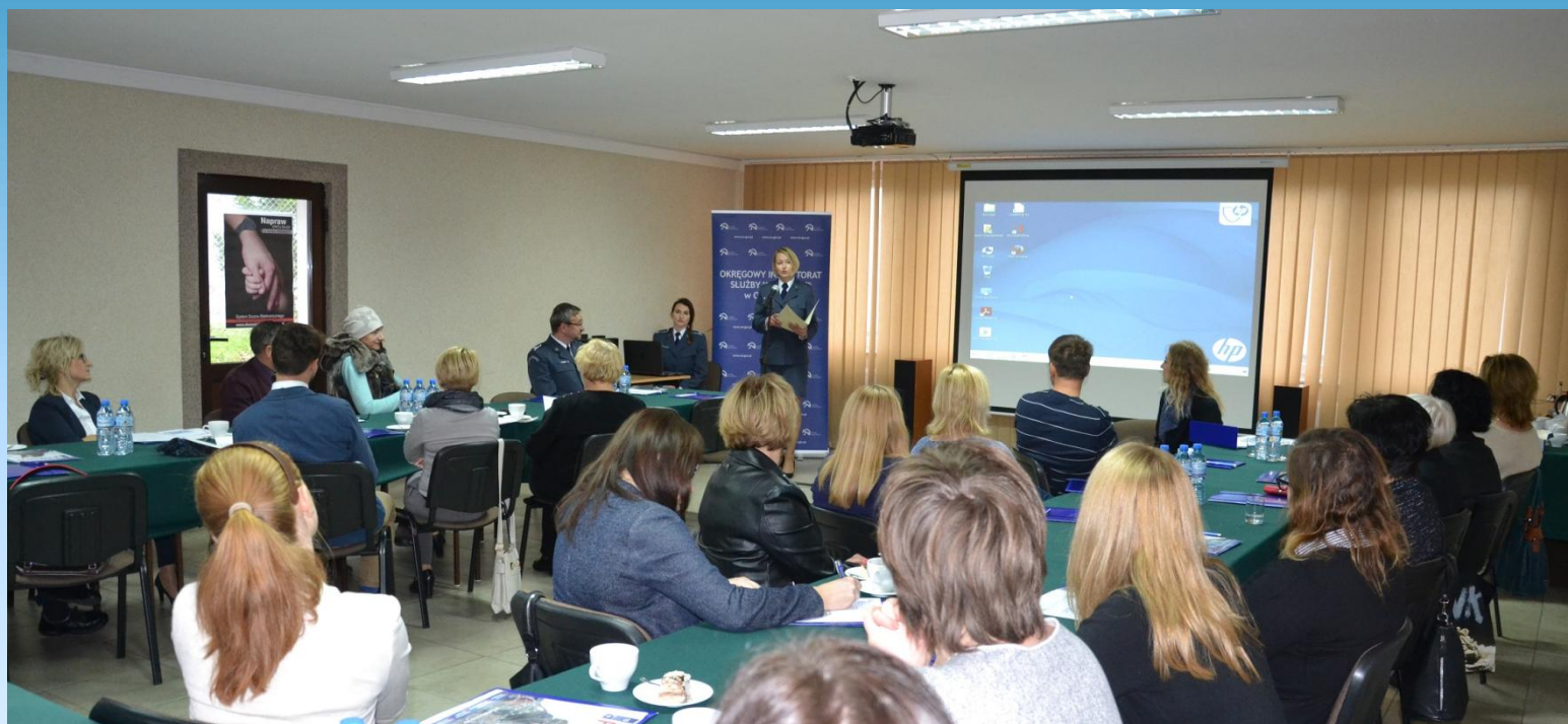
Konferencja - „Nowe wyzwania rynku pracy – zatrudnienie jako główny aspekt readaptacji społecznej osób pozbawionych wolności” Areszt Śledczy w Olsztynie - 21.10.2016 r.