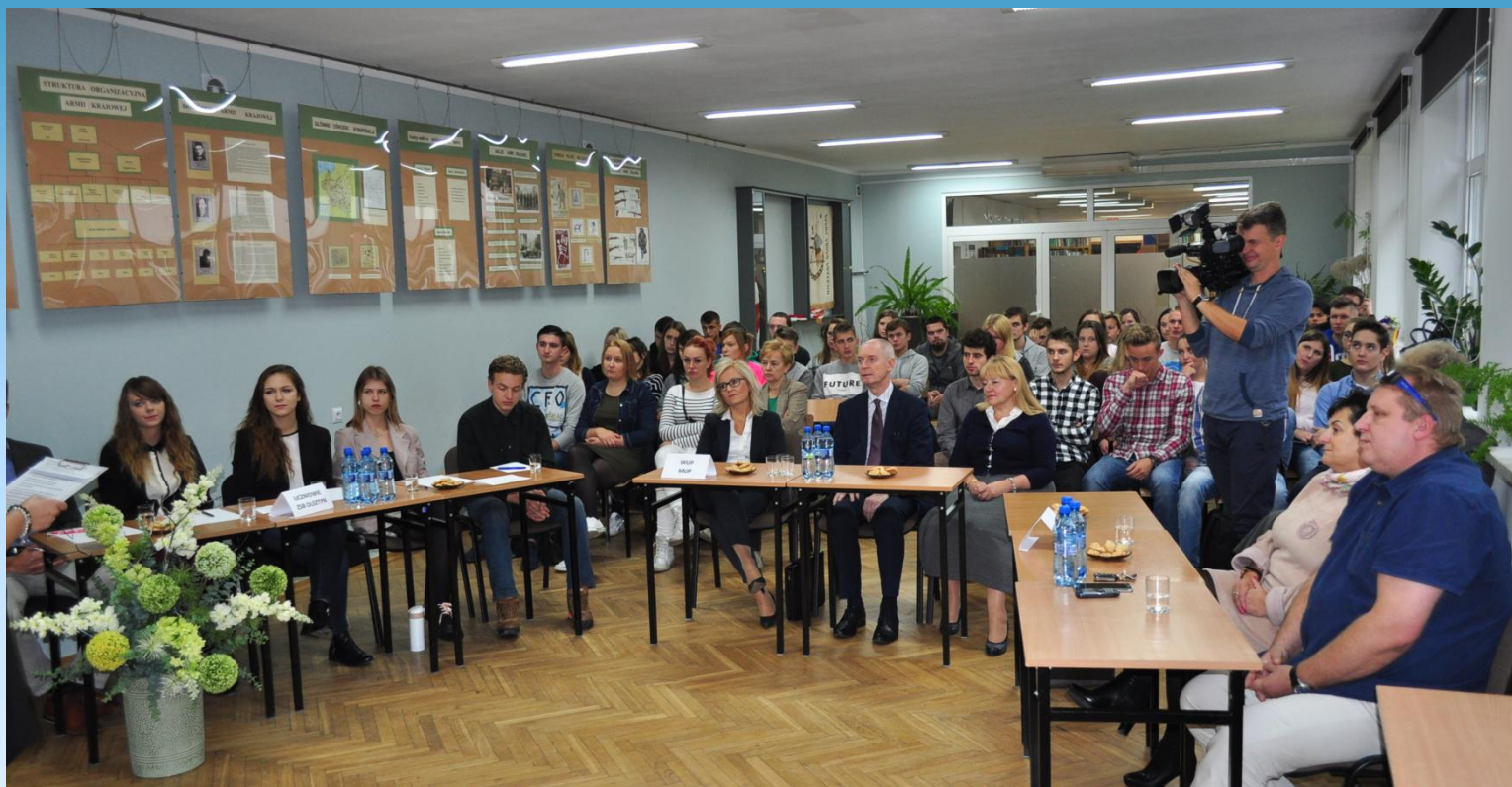
Debata - „Nowe wyzwania rynku pracy” Zespół Szkół Budowlanych w Olsztynie - 20.10.2016 r.