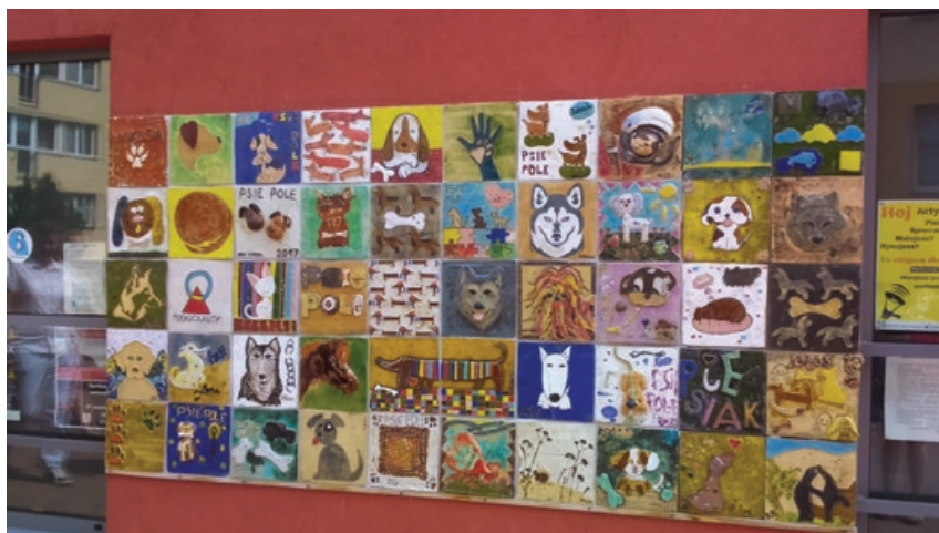
Okładzina elewacji wykonana z ceramiki – „Stara Piekarnia”

oraz wymienić się pomysłami i doświadczeniem. Działalność Starej Piekarni opiera się przede wszystkim na funkcjonowaniu dwóch pracowni – kulinarnej i artystycznej. Organizowane są w niej warsztaty artystyczne, wernisaże, wystawy, spotkania ze znanymi ludźmi, przyjęcia urodzinowe prowadzone przez doświadczonego animatora. Oprócz oferty gastronomiczno-cateringowej główną dziedziną działań Starej Piekarni są warsztaty ceramiki. Znajduje się tu pracownia ceramiczna wraz z piecami do wypalania ceramiki. Trzy razy w tygodniu, popołudniami odbywają się warsztaty dla indywidualnych chętnych. Przez cały rok realizowane są zajęcia dla grup zorganizowanych, dorosłych i dzieci. Warsztaty ceramiczne mogą być również prowadzone, pod wskazanym adresem, na terenie całego miasta. Aktywizacja zawodowa w Starej Piekarni realizowana jest poprzez szkolenia, praktyki, staże, a także zatrudnienie. Dofinansowanie na rzecz aktywizacji pochodzi między innymi z realizacji projektu pn. „Wsparcie działań kawiarni Starej Piekarni jako szkoleniowo-stażowego miejsca rehabilitacji społecznej i zawodowej dla osób zagrożonych społecznym wykluczeniem, osób niepełnosprawnych i doświadczonych