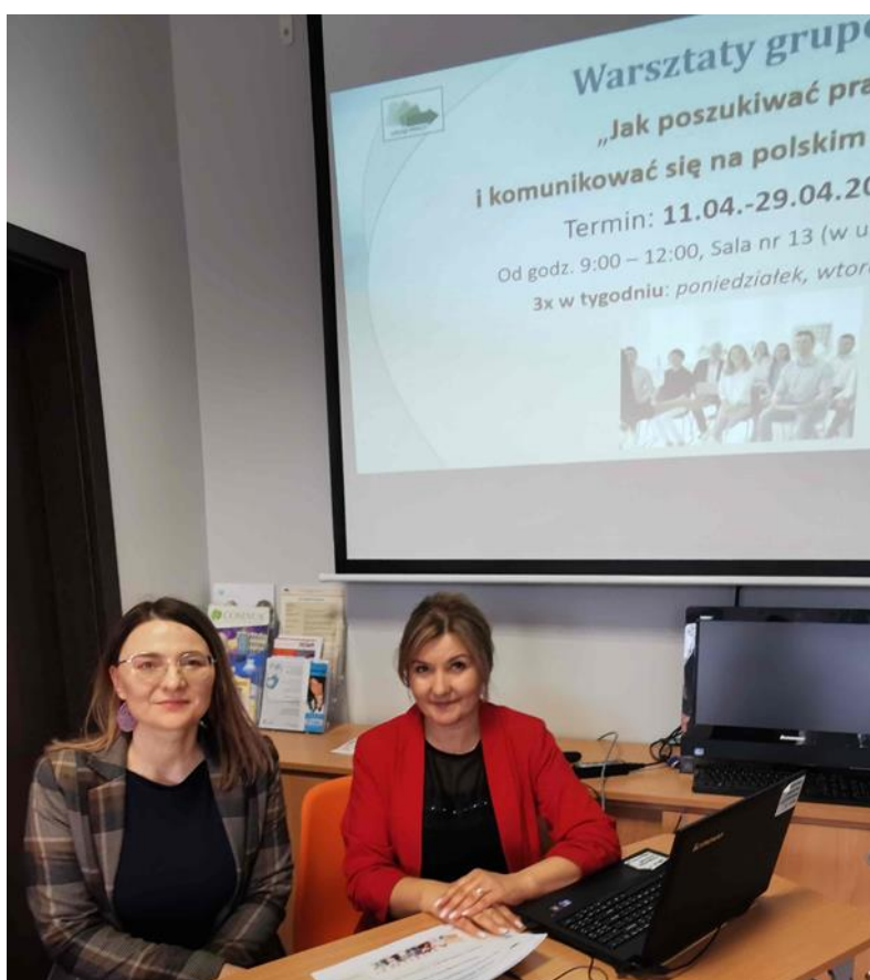
Doradcy Zawodowi PUP Szczytno-spotkanie informacyjne dla obywateli ukraińskich.

Na takich spotkaniach właśnie rozpoczęliśmy również rekrutację na warsztaty grupowe w ramach poradnictwa zawodowego pn. „Jak poszukiwać pracy i komunikować się na polskim rynku pracy” .