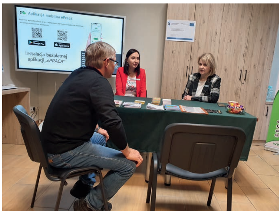
Pracodawca uczestniczący w spotkaniu