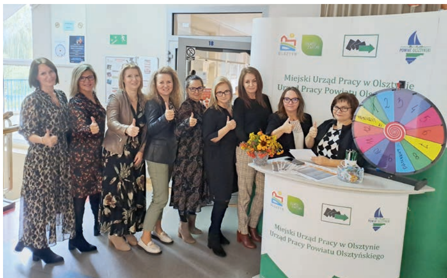
Pracownicy Miejskiego Urzędu Pracy i Urzędu Pracy Powiatu Olsztyńskiego

W tym roku w powyższej inicjatywie uczestniczyli także przedstawiciele lokalnego pracodawcy z firmy