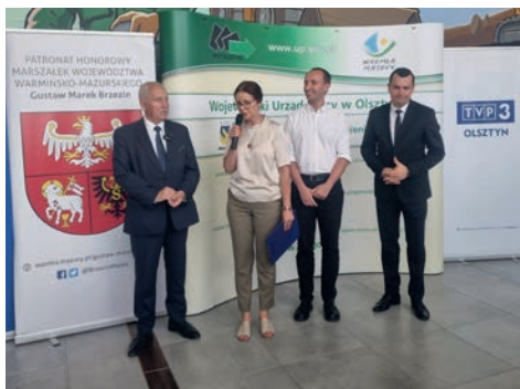
Uroczyste otwarcie Miasteczka zawodów i umiejętności Warmia Mazury 2023