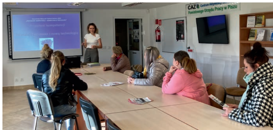
Uczestnicy wykładu przeprowadzonego przez pracownika Powiatowego Urzędu Pracy w Pisz

Kolejnym przedsięwzięciem było spotkanie z uczniami szkoły zawodowej, które miało na celu przybliżyć osobom młodym możliwości wsparcia finansowego na otwarcie firmy, zapoznać ich z podstawowymi zagadnieniami związanymi z rolą i strukturą biznesplanu. Przedstawiliśmy trendy kształtujące rynek pracy, czyli tzw. biznesy przyszłości. Pokazaliśmy uczniom, jaki wpływ na kształtowanie kompetencji ma sztuczna inteligencja.