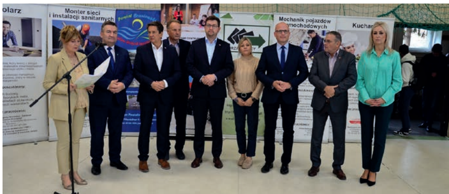
Braniewskie Targi Pracy i Przedsiębiorczości