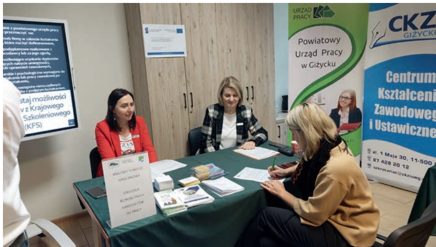
Pracodawca uczestniczący w spotkaniu

Uczestnicy spotkania w ramach indywidualnych konsultacji zapoznali się z zasadami ubiegania się o dofi-