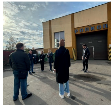
Wizyta studyjna w PPH Porkon sp. z o.o. w Orniecie

niwelowania braków edukacyjnych. Uczestnicy spotkania otrzymali również informacje na temat aktualnie dostępnych ofert szkoleniowych, sytuacji na lokalnym rynku pracy i oczekiwań pracodawców wobec kandydatów do pracy w zakresie umiejętności i kompetencji zawodowych.