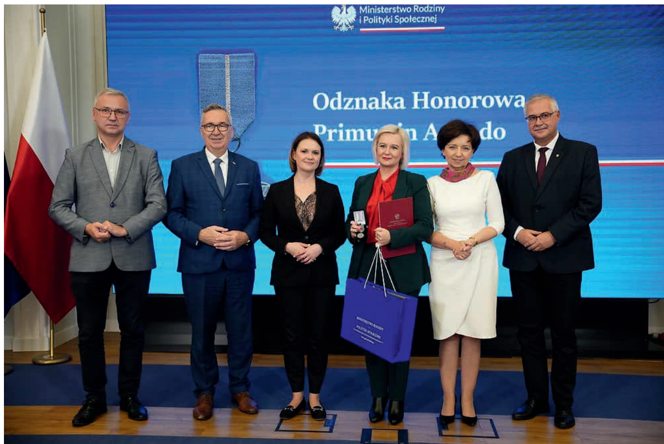
Uroczystość wręczenia odznak honorowych przez Minister Rodziny i Polityki Społecznej Panią Marlenę Małąg