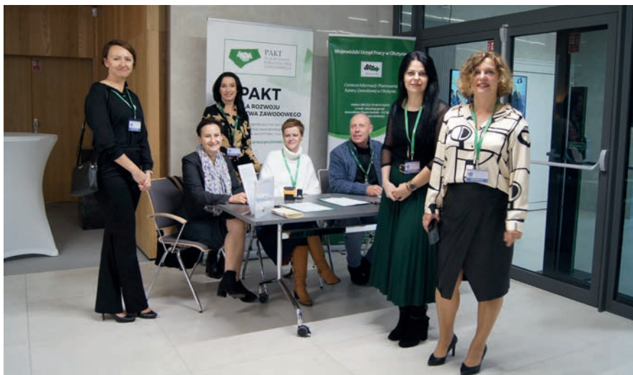
Zespół CliPKZ i PPK, WUP w Olsztynie