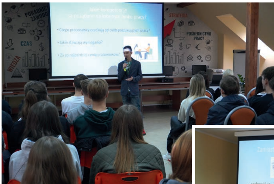
Prezes Fundacji Rozwoju Regionu Gołdap