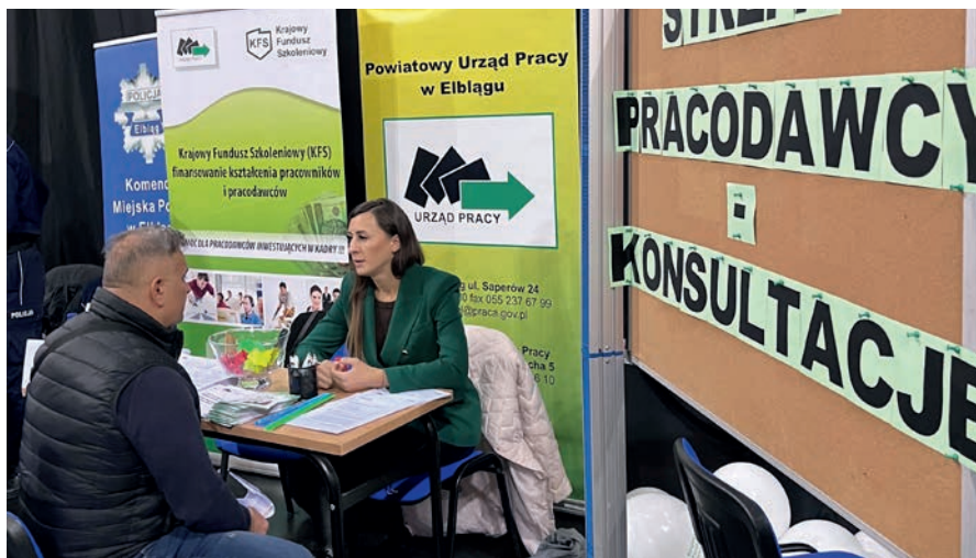
Strefa pracodawcy – jedno ze stoisk PUP w Elblągu

W Targach wzięło udział 61 wystawców oraz 14 szkół ponadpodstawowych, w tym Specjalny Ośrodek Szkolno-Wychowawczy nr 1 w Elblągu i Centrum Kształcenia Zawodowego i Ustawicznego – Elbląskie Centrum Edukacji Zawodowej w Elblągu. Gościliśmy 41 pracodawców, 1 agencję zatrudnienia, 3 szkoły i 1 jednostkę szkolącą. Obecnych było również 15 innych jednostek w tym Powiatowy Urząd Pracy w Braniewie i Powiatowy Urząd Pracy w Nowym Dworze Gdańskim. Przedstawiono łącznie 844 wolnych miejsc pracy w różnych branżach oraz zawodach. Pracodawcy przedstawili 601 ofert pracy. Agencja zatrudnienia zaprezentowała 11 miejsc pracy w Polsce. Ponadto 220 ofertami pracy dysponowały urzędy pracy, a Ochotnicze Hufce Pracy – Centrum Edukacji i Pracy Młodzieży w Elblągu przedstawiły 12 ofert pracy. Przedstawiciele jednostki szkoleniowej przedstawili aktualną ofertę kursów i szkoleń. Ofertę edukacyjną szkolnictwa wyższego przedstawiły Akademia Medycznych i Społecznych Nauk Stosowanych