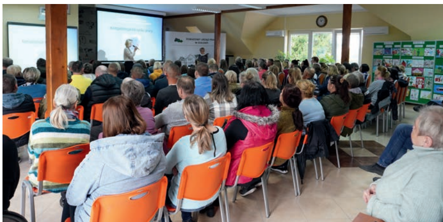
Otwarcie spotkania informacyjnego z osobami bezrobotnymi

Doradcy zawodowi przybliżyli tematykę kompetencji. Omówili ich rodzaje oraz wagę jaką pełnią na rynku pracy. Uczestnicy spotkań dowiedzieli się, że obok konkretnych kwalifikacji zawodowych ważne są także kompetencje miękkie. Starano się uświadomić uczestnikom jak duży wpływ na współczesną rzeczywistość, w tym na trendy kształtujące rynek pracy, mają nowe technologie oraz w jaki sposób zmiany technologiczne