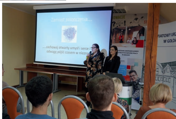
Przedstawicielki z Młodzieżowego Centrum Kariery OHP