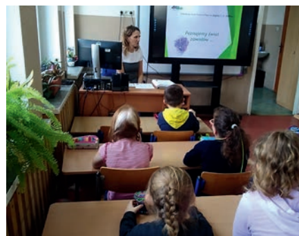
Zajęcia z uczniami szkoły podstawowej

Kolejnym punktem obchodów Tygodnia Kariery był wykład dla osób bezrobotnych „Przyszłość kompetencji – interakcje człowieka z nową technologią”. Jego celem było przybliżenie jednego z najważniejszych trendów kształtujących współczesną rzeczywistość – sztuczną inteligencję oraz