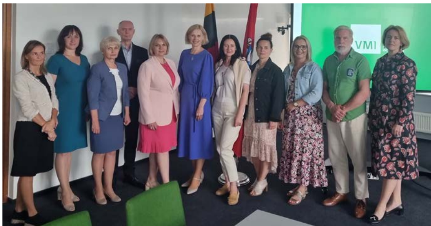
Wizyta w Państwowej Inspekcji Podatkowej w Wilnie

W związku z realizacją zapisów Porozumienia o współpracy, w dniach 12-14 czerwca 2023 r. delegacja