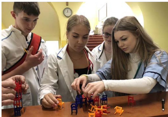
Drużyna Zespołu Szkół Ogólnokształcących w Ornece