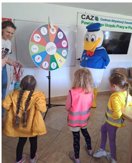
Zajęcia z przedszkolakami z Zespołu Szkolno-Przedszkolnego Nr 1 w Piszcu