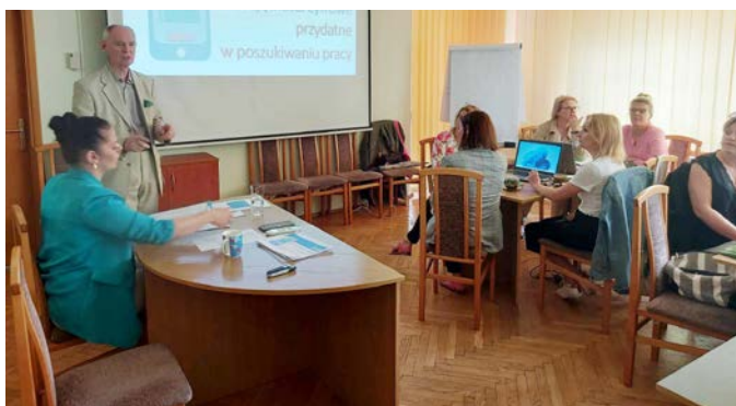
Szkolenie pt. Umiejętności cyfrowe przydatne w poszukiwaniu pracy zorganizowane w siedzibie CiPKZ w Olsztynie

Centrum Informacji i Planowania Kariery Zawodowej Wojewódzki Urząd Pracy w Olsztynie