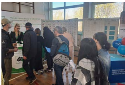
V Olsztyńskie Targi Pracy

Na targi przybyło wiele osób bezrobotnych, poszukujących pracy oraz młodzieży szkół ponadpodstawowych, łącznie odwiedziło targi około 1000 osób. Wystawcy oraz organizatorzy przedstawili bogatą ofertę. Zaprezentowano ponad 840 miejsc pracy. Była to doskonała okazja do bezpośredniego kontaktu zainteresowanych osób z przedstawicielami firm reprezentującymi różne branże. Dużym zainteresowaniem cieszyły się oferty pracy w służbach mundurowych. Podczas targów odbywały się warsztaty dla osób bezrobotnych pod nazwą: „Rozmowa kwalifikacyjna – twój sukces”,