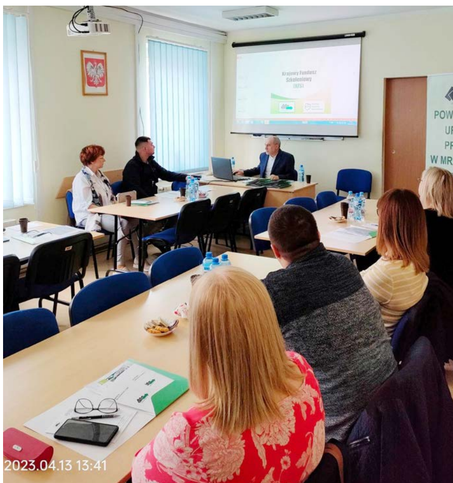
Spotkanie nr 4

Inicjatywy w tym tygodniu zostały zaplanowane i zorganizowane z myślą