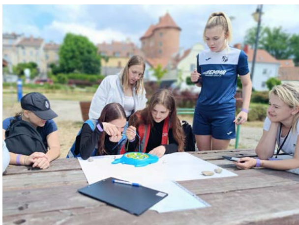
Drużyna Katolickiego Liceum Ogólnokształcącego w Lidzbarku Warmińskim