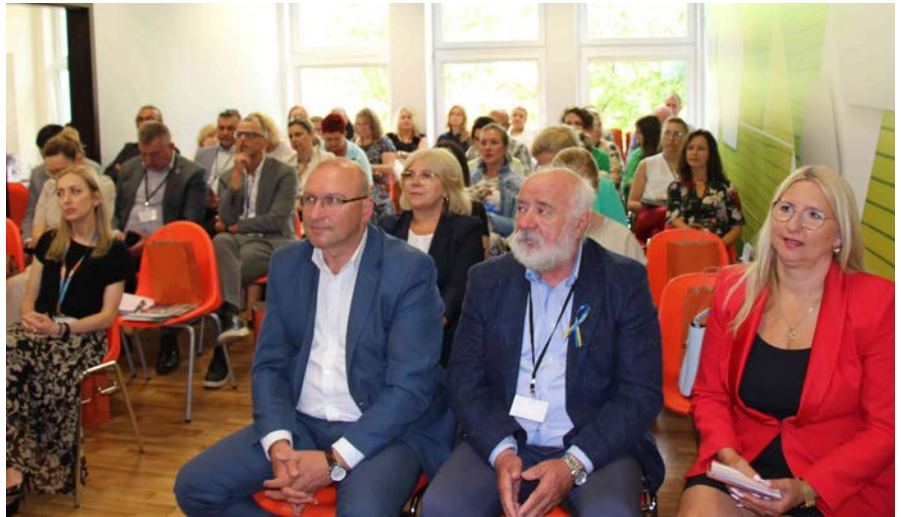
Uczestnicy seminarium zorganizowanego w siedzibie PUP w Szczytnie