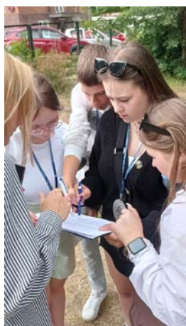
Drużyna Zespołu Szkół Zawodowych w Lidzbarku Warmińskim