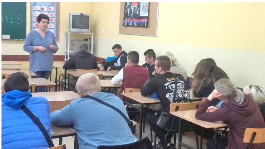
Spotkanie informacyjne w Zespole Szkół Zawodowych i Ogólnokształcących w Nidzicy.

Pierwsze spotkania pod nazwą „Zawody przyszłości, czyli kto będzie potrzebny za kilka lat?” odbyły się 25.04.2023 r. w Zespole Szkół Zawodowych i Ogólnokształcących w Nidzicy. Wzięło w nich udział 54 uczniów klas trzecich o profilach: prawno-społecznym, wojskowym, informatycznym i logistycznym. Licealiści uzyskali informację o trendach, branżach i zawodach przyszłości. Ale skąd ta wiedza? Otóż, rokrocznie, od 8 lat eksperci PUP w Nidzicy przeprowadzają badanie pod nazwą „Barometr Zawodów”, który jest prognozą zapotrzebowania na pracowników w powiecie nidzickim w kolejnym roku. Spotkania z młodzieżą miały na celu uświadomienie im przyszłych wyzwań na rynku pracy. Wraz z rozwojem nowych technologii zmianie ulega również rynek pracy, co wiąże się z koniecznością ciągłego doskonalenia umiejętności zawodowych, by sprostać wymaganiom pracodawców.