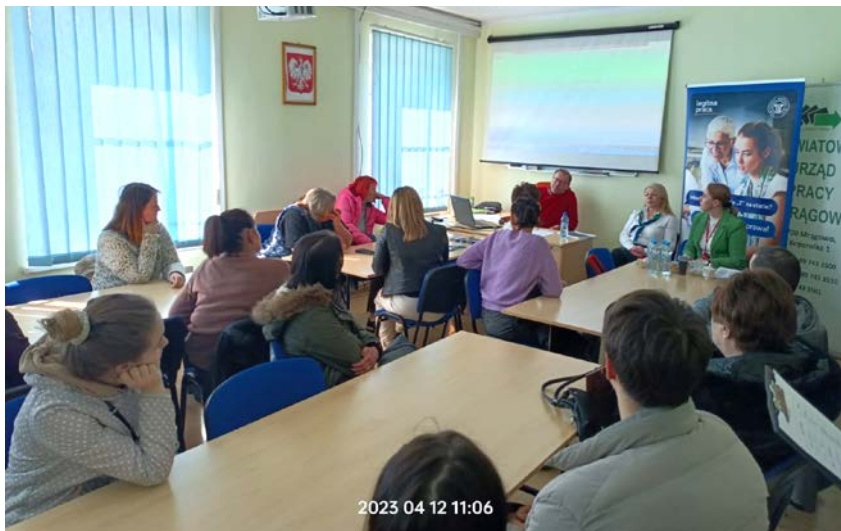
Spotkanie nr 2