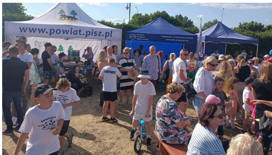
XXV Warmińsko-Mazurskie Dni Rodziny „Razem tworzymy rodzinę”