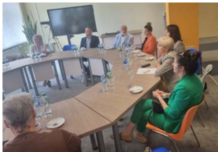
Wizyta w Centrum Szkolenia Zawodowego w Alytusie

Temat związany z poprawą sytuacji osób oddalonych od rynku pracy był kontynuowany w ramach kolejnego spotkania z przedstawicielami Kowieńskiego Departamentu Obsługi Klientów w Alytusie. To jedna z instytucji służb zatrudnienia, która także podjęła kroki, w ramach projektu pilotażowego i rozpoczęła aktywizację osób przygotowujących się do rynku pracy. Z uwagi na fakt, iż jest to nowe zadanie, służby zatrudnienia podejmują szereg działań, których celem jest przeszkolenie i przygotowanie kadry, która będzie oddelegowana do tych inicjatyw. W ramach projektu pilotażowego w samorządach regionu wytypowano osoby, które mogą zostać objęte działaniami (w sumie 733 osoby, co stanowi 15% ogółu osób zarejestrowanych w urzędzie pracy w tym regionie). Interującym jest fakt, iż rozmowy wstępne i rekrutacja tych osób odbywa się na poziomie gmin, które odpowiedzialne są za zaproszenie tych osób na spotkanie, podpisanie deklaracji uczestnictwa w projekcie oraz przygotowanie Indywidualnego