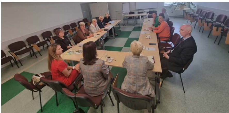
Spotkanie w Kowieńskim Departamencie Obsługi Klientów w Alytusie

Pierwszą instytucją, którą odwiedziła nasza delegacja była Państwowa Inspekcja Podatkowa, gdzie Pani Dyrektor zaprezentowała główne założenia realizowanego projektu pn.: „Zmniejszenie ryzyka pracy nierejestrowanej”. Omówiła podstawowe założenia projektu, którego celem jest zmniejszenie ryzyka pracy nierejestrowanej na Litwie. Projekt jest realizowany we współpracy z samorządami. Starostowie regionów są ambasadorami projektu, instytucją zajmującą się ubezpieczeniem zdrowotnym i społecznym oraz służbami zatrudnienia. Pierwszym etapem było wdrożenie działań w ramach projektów pilotażowych. Obecnie trwają prace nad propozycjami do wprowadzenia zmian ustawowych w zakresie stworzenia aktów prawnych regulujących np. kierunki kontroli podmiotów zatrudniających „na czarno”. Zaprezentowany projekt jest podobny do projektu, w którym brał udział Wojewódzki Urząd Pracy w Olsztynie pn.: „Budowa i wdrażanie innowacyjnych narzędzi ograniczających zjawisko pracy nierejestrowanej w instytucjach współodpowiedzialnych za minimalizację zjawiska „szarej strefy” na rynku pracy”. W ramach naszego projektu miały miejsce szkolenia dla