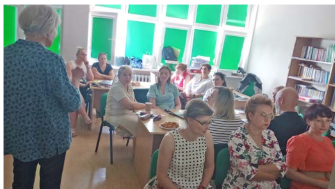
Szkolenie pt. Umiejętności cyfrowe przydatne w poszukiwaniu pracy zorganizowane w siedzibie CiPKZ w Elblągu