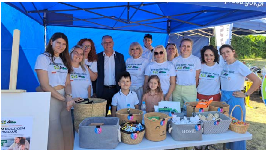
Starosta Powiatu Piskiego oraz Dyrekcja i Pracownicy Powiatowego Urzędu Pracy podczas Festynu Rodzinnego