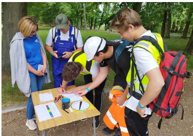
Drużyna Zespołu Szkół Zawodowych w Ornece