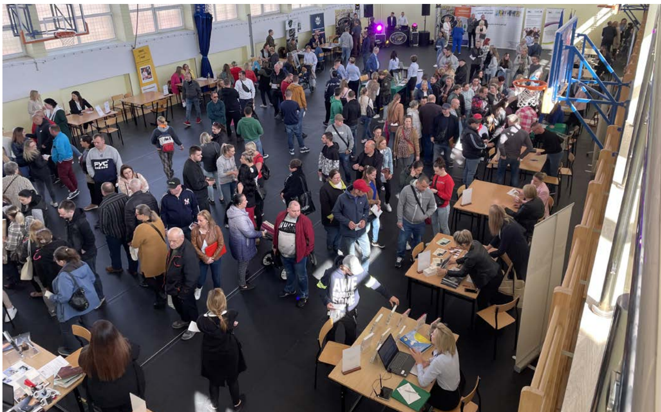
Uczestnicy Powiatowych Targów Pracy 2023