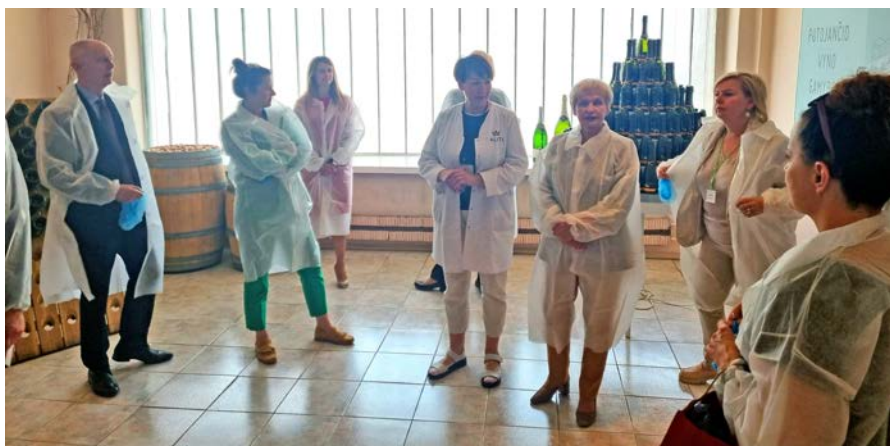
Wizyta w centrum produkcyjnym Alita w Alytusie

Wydział Polityki Rynku Pracy Wojewódzki Urząd Pracy w Olsztynie