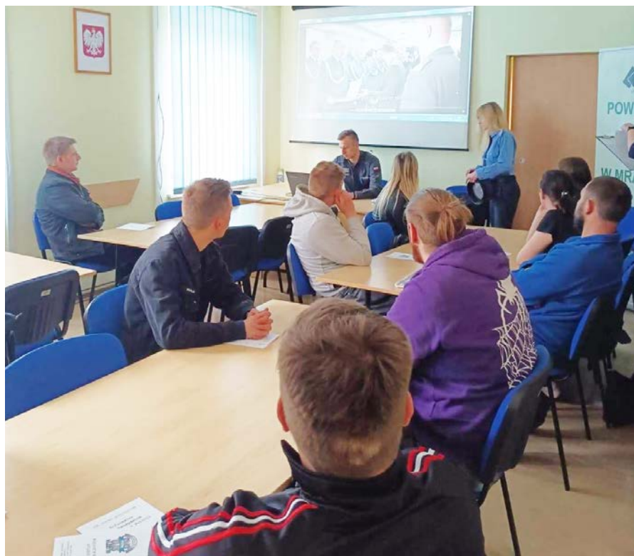
Spotkanie informacyjne z przedstawicielem Komendy Powiatowej Policji w Mrągowie oraz Funkcjonariuszami Zakładu Karnego w Barczewie