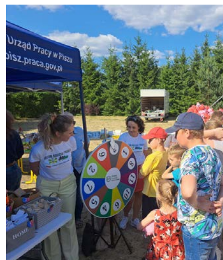
Gry i zabawy na stanowisku Powiatowego Urzędu Pracy w Pisz