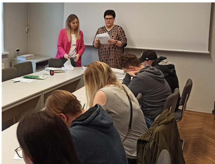
Grupowa informacja dla młodzieży.