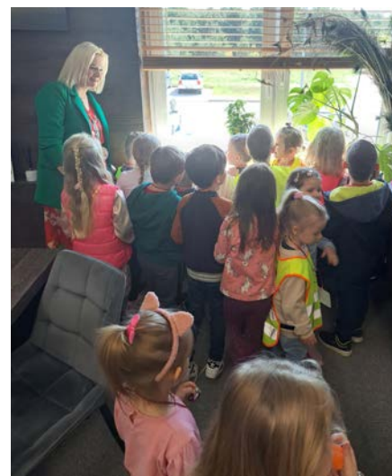
Odwiedziny w gabinecie Dyrektora Powiatowego Urzędu Pracy w Piszcu