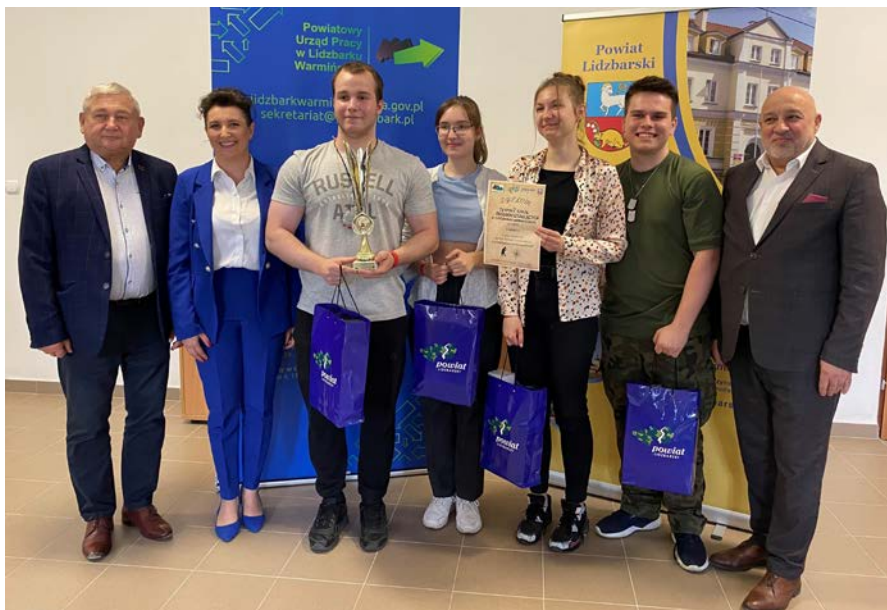
Zwycięska drużyna I edycji gry terenowej – Zespołu Szkół Ogólnokształcących w Lidzbarku Warmińskim