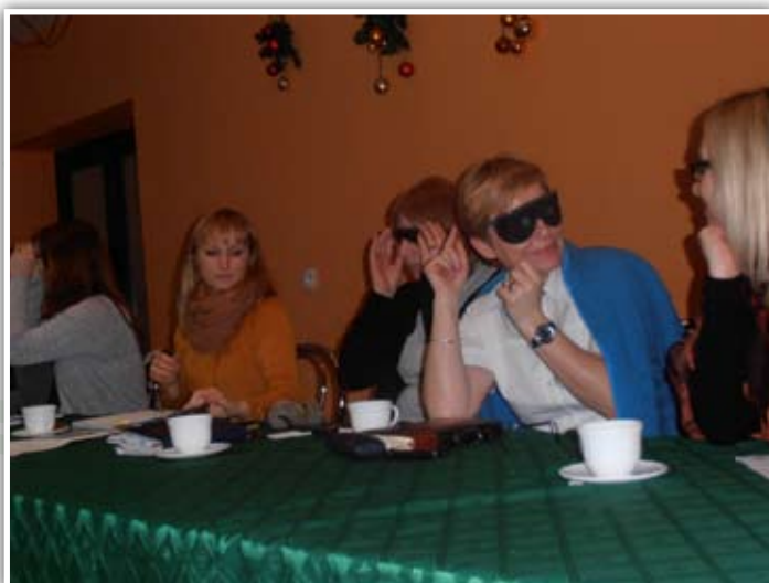
Wizyta ekspertów w Polsce – warsztaty

Zatrudnienie wspomagane to metoda umieszczania osób z niepełnosprawnością na otwartym rynku pracy z pomocą trenera pracy. Zapewnia ono wsparcie dla osób z niepełnosprawnością oraz osób wykluczonych. Pozwala im zdobyć i utrzymać etat. Koncepcja zatrudnienia wspomagane została opracowana i wprowadzona w życie w Stanach Zjednoczonych pod koniec lat 70-tych ubiegłego wieku. Szybko jednak zaczęła przenikać do innych krajów. W Europie prekursorem tej metody była Wielka Brytania. Przy jej wsparciu Warmińsko-Mazurski Sejmik Osób Niepełnosprawnych realizuje projekt na rzecz osób niewidomych i słabowidzących. Wzięły w nim udział 43 osoby, w tym 26 kobiet. – Przeprowadzona diagnoza i analizy środowiska osób niewidomych i słabowidzących wskazywały, że sytuacja kobiet w tej grupie jest trudniejsza, mniej z nich pracuje, a ponad połowa chciałaby podjąć pracę. Zwracaliśmy uwagę na ten aspekt podczas rekrutacji. Jednak