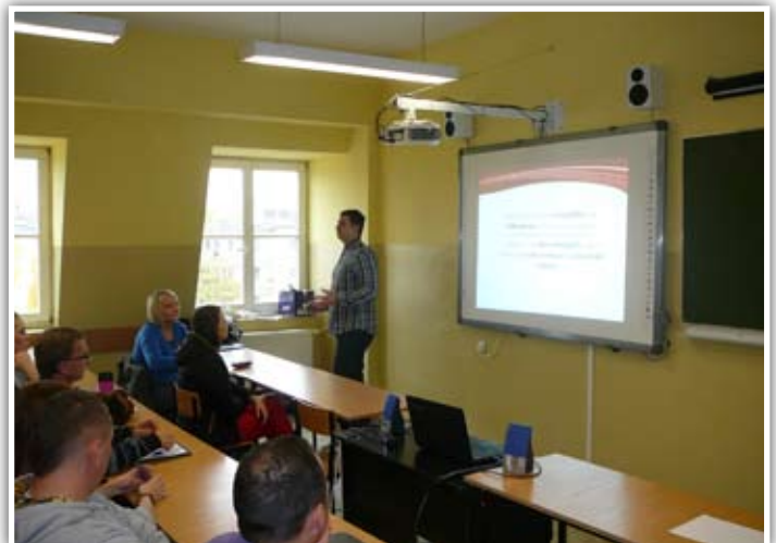
Warsztaty dla studentów WSliE – Jak aktywnie poszukiwać bezpiecznej pracy w kraju i za granicą

19 października 2015 roku w Iławie odbyła się powiatowa konferencja pn: „Poznaj swojego doradcę kariery – wybierz świadomie przyszłość” zorganizowana przez Młodzieżowe Centrum Kariery OHP oraz Poradnię Psychologiczno-Pedagogiczną w Iławie, której celem było uświadomienie uczestnikom wagi świadomego planowania kariery zawodowej oraz roli doradcy zawodowego w tym procesie. Dnia 20 października 2015 roku w konferencji pn. „Planuj karierę i pracuj bezpiecznie” zorganizowanej przez Powiatowy Urząd Pracy w Działdowie mogli wziąć udział mieszkańcy powiatu działdowskiego. Podczas konferencji przedstawione zostały m.in. temat finansowania działalności gospodarczej, zawodów przyszłości i globalnych trendów na rynku pracy, bezpiecznego planowania kariery i pracy za granicą. Więcej informacji na ten temat w artykule autorstwa Beaty Wawer. Tego samego dnia w Gołdapi można było wziąć udział