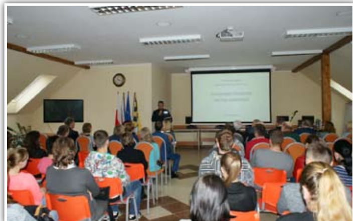
Mł. insp. Ryszard Stemplewski, Zastępca Komendanta Powiatowego Policji w Gołdapi