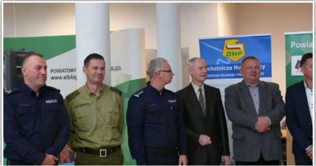
Uroczyste otwarcie Elbląskich Targów Pracy

Wszyscy wystawcy dysponowali łącznie 1315 ofertami pracy, w tym 370 zagranicznymi.