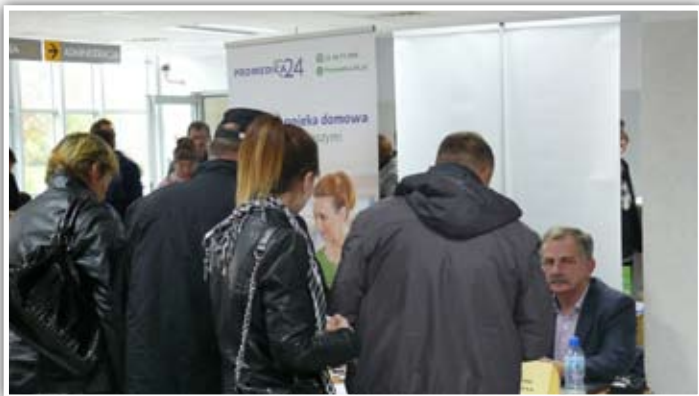
Stanowisko targowe pracodawców i agencji zatrudnienia

Poszukiwano kandydatów do pracy m.in. w branży stolarskiej, mechanicznej, elektronicznej i budowlanej. Pracodawcy dysponowali również wolnymi miejscami pracy biurowej, dla nauczycieli, a także z zakresu ubezpieczeń i call center.