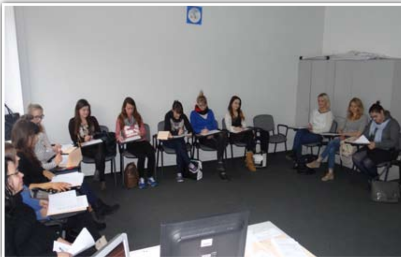
Warsztaty dla studentów. Planuj karierę i pracuj bezpiecznie.

W tygodniu kariery na Warmii i Mazurach mieszkańcy powiatów mogli również skorzystać z indywidualnych konsultacji specjalistów urzędów pracy oraz z grupowych otwartych spotkań informacyjnych organizowanych w ramach Dni Informacyjnych, Dni Otwartych oraz Dni Otwartych Poradnictwa Zawodowego organizowanych przez powiatowe urzędy pracy w: Lidzbarku Warmińskim, Mrągowie oraz Piszcu. Poznać swojego doradcę kariery i zaplanować swoją karierę mogli również żołnierze z Bartoszych, Gołdapi, Orzysza, Elbląga i Białegostoku, ponieważ dla nich spotkania i warsztaty w ramach OTK 2015 zorganizowali doradcy zawodowi z Ośrodka Aktywizacji Zawodowej w Olsztynie. Najwięcej wydarzeń w całym regionie zorganizowano dla młodzieży szkolnej i akademickiej. Były to spotkania informacyjne, prelekcje, warsztaty, konkursy, dyskusje, prezentacje, wizyty studyjne. Dzięki temu, iż w każdym powiecie zostały utworzone zespoły specjalistów, w składzie: doradcy zawodowi urzędów pracy, jednostek organizacyjnych OHP, poradni psy-