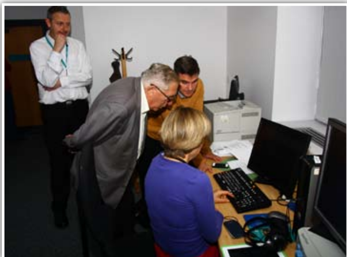
Wizyta w Glasgow – prezentacja specjalistycznego sprzętu