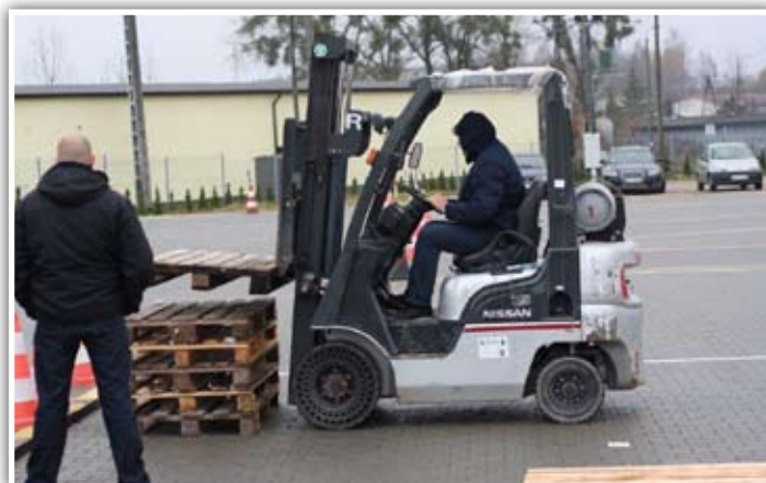
Szkolenia w firmie Agapit

Projekt miał działanie długofalowe. Szkolenia i usprawnienia firmy dopiero po jakimś czasie dały się zauważyć w konkretnych liczbach. - Projekt oceniam pozytywnie, ale przestrzegam, żeby nie planować większych projektów niż jesteśmy w stanie wykonać. Środki w ramach tych działań są relatywnie łatwe do pozyskania. Polecam innym przedsiębiorcom daleko idącą racjonalność i celowanie w rzeczy, które naprawdę zwiększą