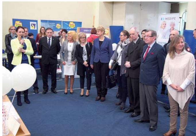
Uroczyste otwarcie targów

W specjalnie przygotowanym punkcie konsultacyjno-informacyjnym WUP, MUP, UPPO oraz CEiPM OHP w Olsztynie uczestnicy mogli uzyskać informacje doty-