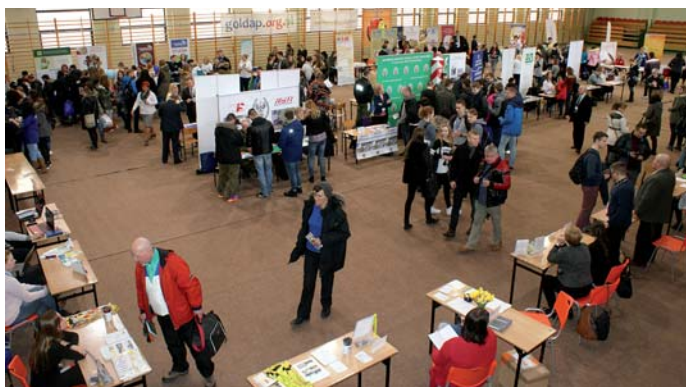
Uczestnicy Targów Pracy i Edukacji

Głównym celem targów było doprowadzenie do bezpośredniego kontaktu wystawców z adresatami przedsięwzięcia. Stworzenie okazji pracodawcom i jednostkom edukacyjnym do zaprezentowania swojej oferty szerokiemu gronu potencjalnych kandydatów oraz