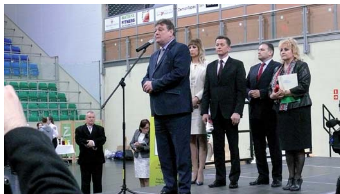
Uroczyste otwarcie Elbląskich Targów Pracy