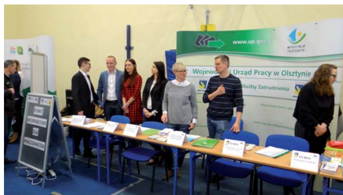
Punkt informacyjny dla pracodawców - eksperci gotowi do udzielania informacji

Z inicjatywy Wojewódzkiego Urzędu Pracy w Olsztynie został utworzony Punkt Informacyjny dla Pracodawców w którym zapewniono kompletną informację na temat form wsparcia, usług i instrumentów rynku pracy realizowanych przez wojewódzki i powiatowe urzędy pracy oraz OHP i kierowanych do przedsiębiorców. Pracodawcy mogli skorzystać z konsultacji i porad specjalistów oraz indywidualnej informacji na temat m.in.: kształcenia ustawicznego pracowników w ramach środków Krajowego Funduszu Szkoleniowego; pomocy w indywidualnym rozwoju zawodowym pracodawcy i jego pracowników oraz pomocy w doborze kandydatów do pracy; pomocy w poszukiwaniu pracowników, w tym pozyskiwania pracowników z wybranych krajów UE/EOG; wsparcia w tworzeniu miejsc pracy, uzyskania pożyczek na utworzenie stanowiska pracy dla bezrobotnego; bezzwrotnej pomocy dla przedsiębiorcy na ochronę miejsc pracy; zatrudnienia cudzoziemców i osób niepełnosprawnych; refundowania kosztów zatrudnienia młodocianych; funduszy europejskich. Z indywidualnych konsultacji udzielonych w punkcie informacyjnym skorzystało 49 pracodawców.