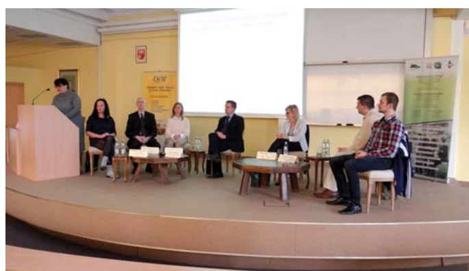
Dyskusja ekspertów podczas sesji naukowej

W trakcie giełdy pracy odbyła się również Sesja Naukowa pt. „Edukacja a praca” z udziałem ekspertów (dyrekcji Wojewódzkiego i Miejskiego Urzędu Pracy w Olsztynie, Centrum Edukacji i Pracy Młodzieży OHP, Olsztyńskiej Szkoły Wyższej oraz przedsiębiorców z Warmii i Mazur). Dyskusja dotyczyła dopasowania kompetencji do potrzeb rynku pracy, zagrożeń wynikających z deficytów kompetencyjnych oraz roli wykształcenia w poszukiwaniu pracy. Zdaniem ekspertów wykształcenie ma nadal duże znaczenie na rynku pracy, jednak pracodawcy oczekują od kandydatów konkretnych kompetencji a szczególnie pożądane są kompetencje miękkie, takie jak: praca w zespole, zaangażowanie, sumienność, uczciwość, dyscyplina. Ekspersi wskazali również na fakt, iż duże znaczenie dla rynku pracy ma kształcenie w systemie dualnym, a placówki kształcenia powinny mieć warsztaty wyposażone w nowoczesny sprzęt. W sesji z udziałem 7 ekspertów, uczestniczyło 47 osób.