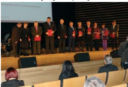
Członkowie Wojewódzkiej Rady Rynku Pracy w kadencji 2016 – 2020