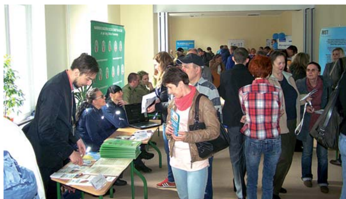
Uczestnicy Kętrzyńskich Targów Pracy

Zaproszenie do udziału w wydarzeniu przyjęło 16 wystawców. Oprócz lokalnych przedsiębiorców, spo-